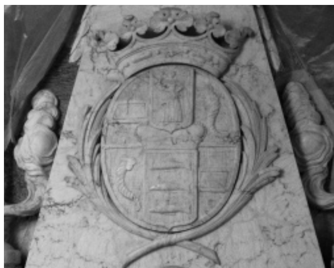
Der Alabaster dieses Grabdenkmals erhält durch eine Politur mit Bienenwachs seinen leichten, ursprünglichen Glanz zurück.

dokumentierte das Restauratorenteam Josef Ineichen und Claudia Knerr sämtliche notwendigen und möglichen Restaurierungsmassnahmen. Entsprechend dem Entscheid der Baukommission konzentrierten sich die folgenden Restaurierungsarbeiten auf die Reinigung und Sicherung (also das Festigen mürber, absandender Steinpartien, das Hinterfüllen von Schalen und Hohlräumen im Stein, das Befestigen bereits loser Teile oder die Oberflächenbehandlung z.B. mit Bienenwachs) und somit die dauerhafte Erhaltung des heutigen Zustandes der Grabdenkmäler. Ergänzungen wurden nur dort angebracht, wo dies die Stabilität der Substanz erhöhte und die Lesbarkeit des Grabdenkmals wesentlich verbesserte.