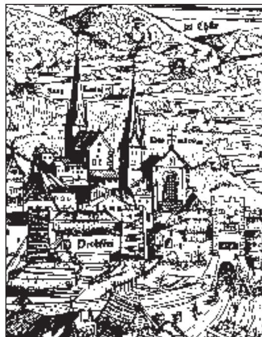
Holzschnitt um 1550: An der Westfassade ist ein Pultdach dargestellt. Auf einem kleinen Friedhof, der sich davor befand, wurden bis ins Spätmittelalter Personen bestattet, die eine besondere Wertschätzung genossen.

Fest steht, dass seit der napoleonischen Zeit für alle bisher Privilegierten und auch kirchliche Würdenträger ausserhalb der Kirche ein Begräbnisplatz gefunden werden musste. Seit dem ausgehenden 19. Jahrhundert dient der erneut verkleinerte Friedhof neben dem Kathedralenportal ausschliesslich als Ruhestätte der Bischöfe und Domherren des Bistums Chur.