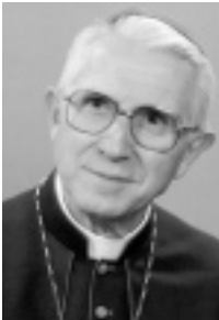
Amédée Grab Bischof von Chur