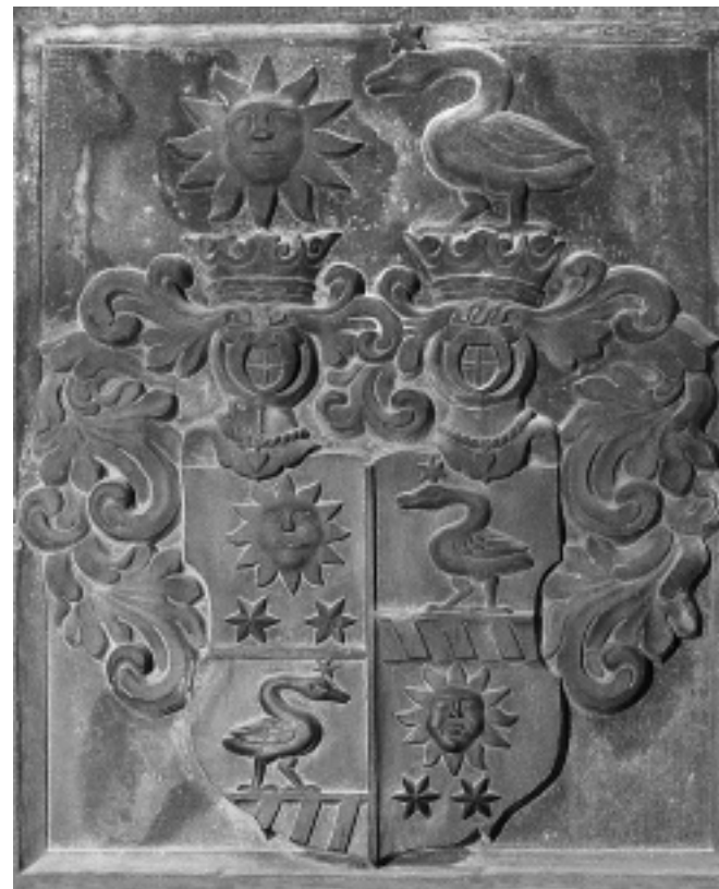
Eine von über 80 Grabplatten und Epitaphien, die in der Kathedrale Chur zu finden sind.

Einer der bekanntesten Namen, der sich mit Wappen und Inschrift auf einer der Grabplatten finden lässt, ist der des Bündner Freiheitskämpfers Jörg Jenatsch. Ursprünglich reformierter Pfarrer in Scharans und später im Veltlin, vertauschte er nach dem Aufstand der Veltliner gegen die reformierten Bündner die Bibel mit dem Schwert und kämpfte einmal unter venezianischer, ein anderes Mal unter französischer Flagge. 1624/25 nahm er an der Rückeroberung seiner Heimat teil, welche die Franzosen nach dem Sieg den Bündnern jedoch nicht zurückgeben wollten. Ohne seine Familie konvertierte Jörg Jenatsch 1635 zum Katholizismus. 1637 befahl er den Aufstand, der zur Vertreibung der Franzosen führte. 1639 kam er unter nicht restlos geklärten Umständen in einer Fastnachtsnacht in einem Churer Gasthaus ums Leben. Berühmtheit erlangte sein Name vor allem durch Conrad Ferdinand Meyers Roman «Jürg Jenatsch», der ihn zu einer heroischen Figur und Allegorie