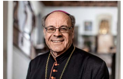
Bischof Vito Huonder.