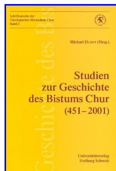
Neue Forschungen zum 1550-jährigen Bistumsjubiläum (2001)