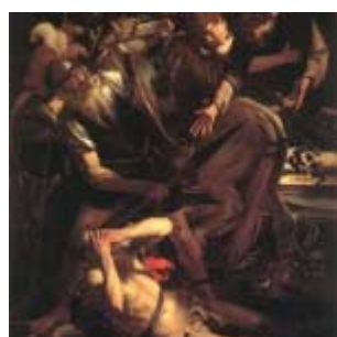
Die Tagespost, 21. Januar 2015

Die Bischofssynode über die Familie kann sich am Handeln des Apostels Paulus orientieren