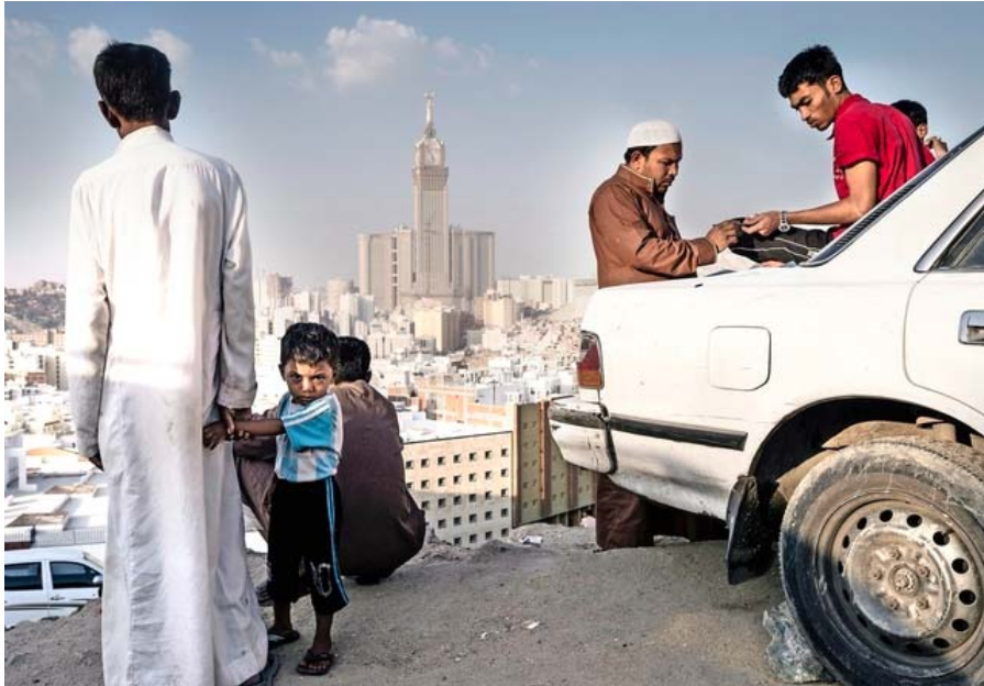
Islamische Herrscher wie der König von Saudiarabien beanspruchen Autorität über ihre Landesgrenzen hinaus. Blick auf Mekka.

Der algerische Autor Boualem Sansal glaubt nicht an einen friedfertigen Islam. Nach der Zeit der Spaltungen und Kriege werde sich ein Führer aller Muslime zu installieren versuchen.