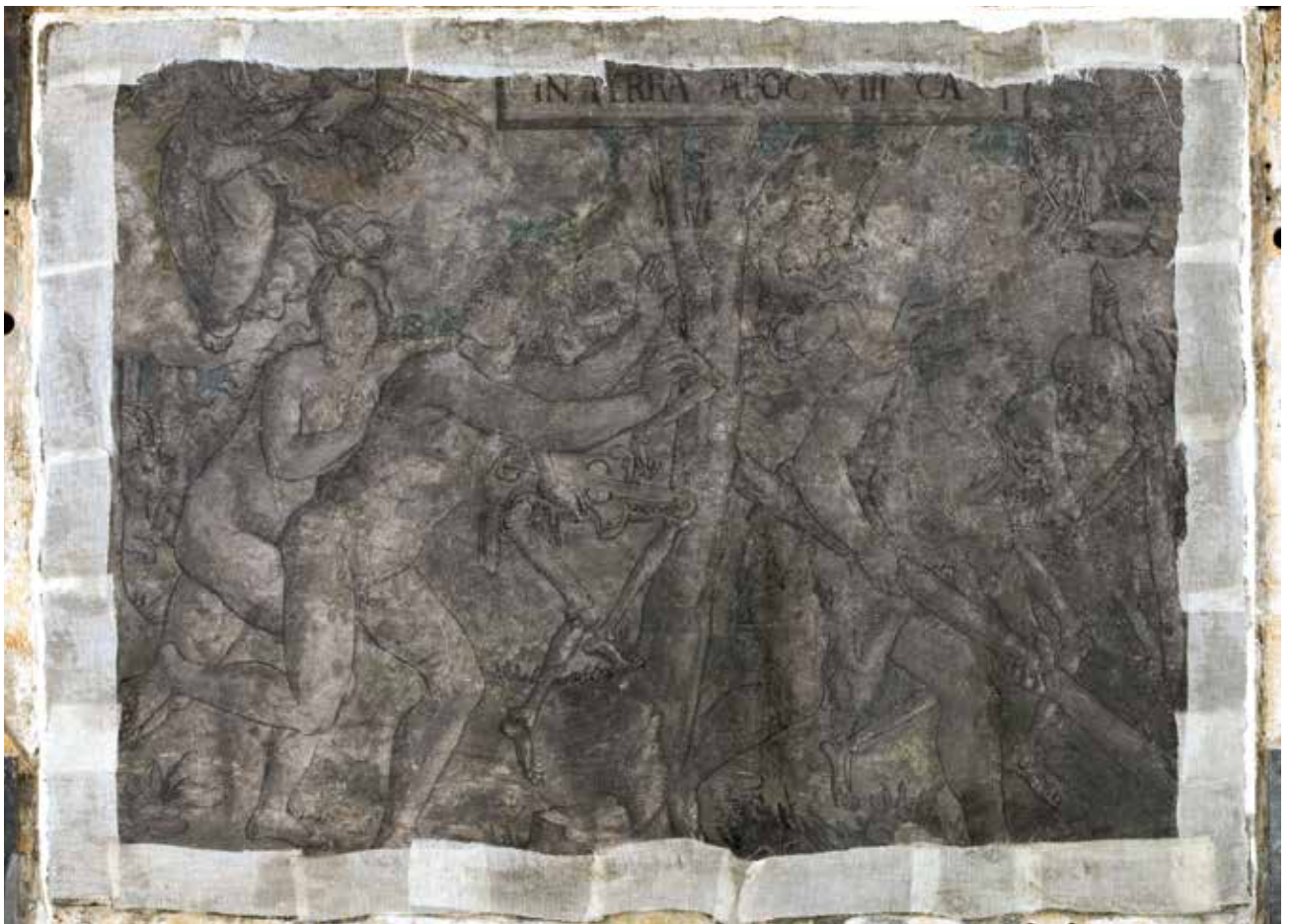
Todesbilder. Szenen Nr. 3, 4 und 5, Austreibung aus dem Paradies, Arbeit der ersten Eltern und Beinhaus.