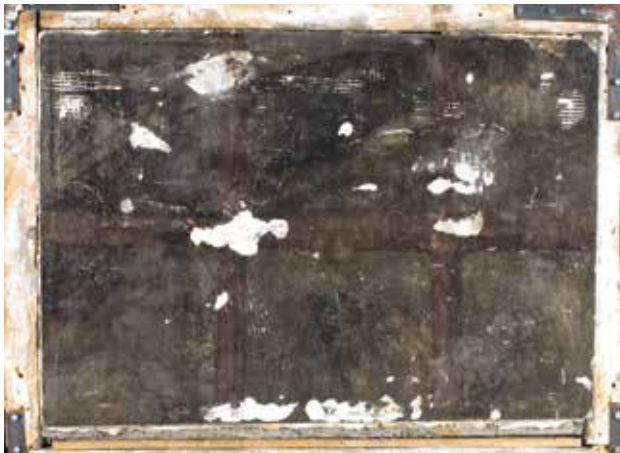
Todesbilder. Sockelfeld 7.