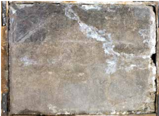
Todesbilder. Sockelfeld 3.