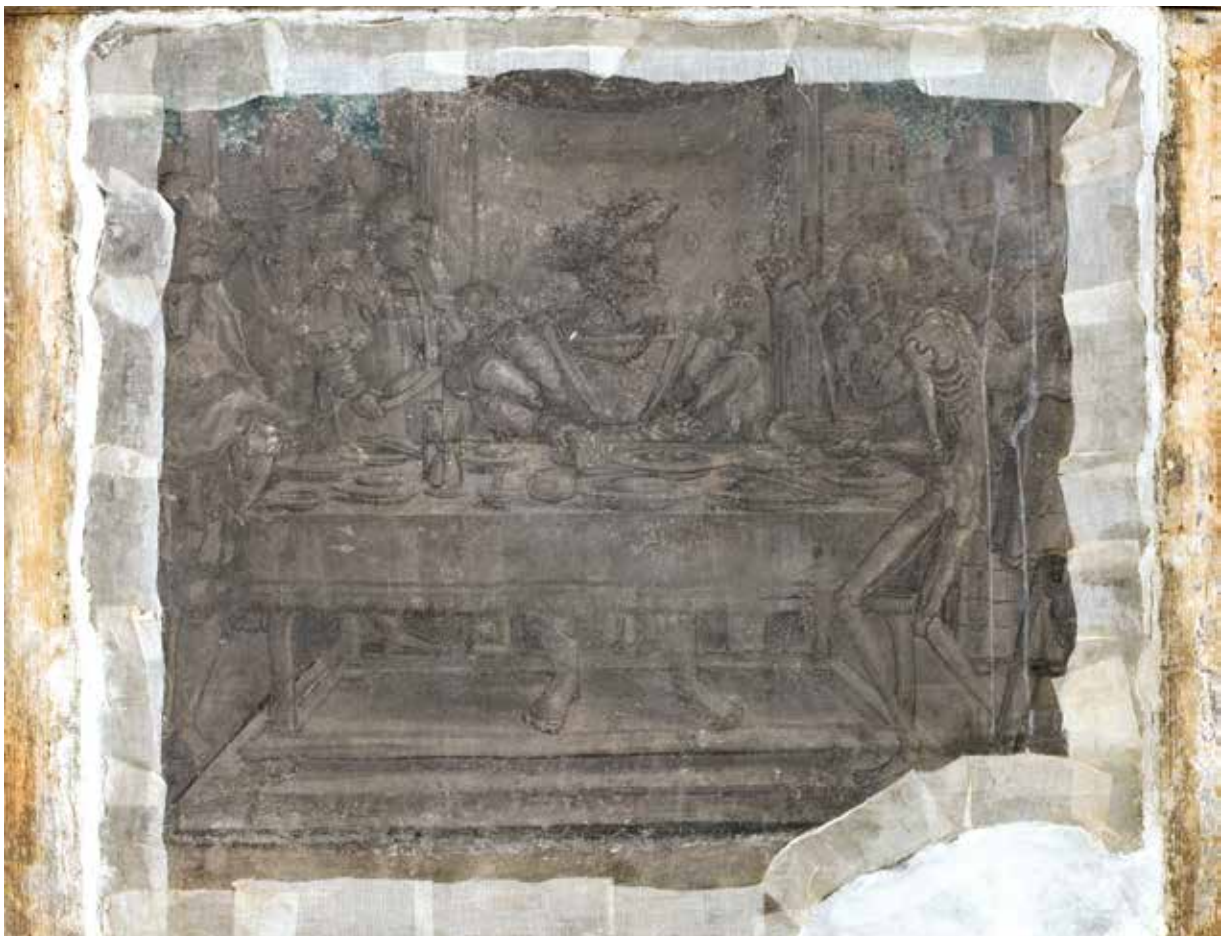
Todesbilder. Szene Nr. 8, König.