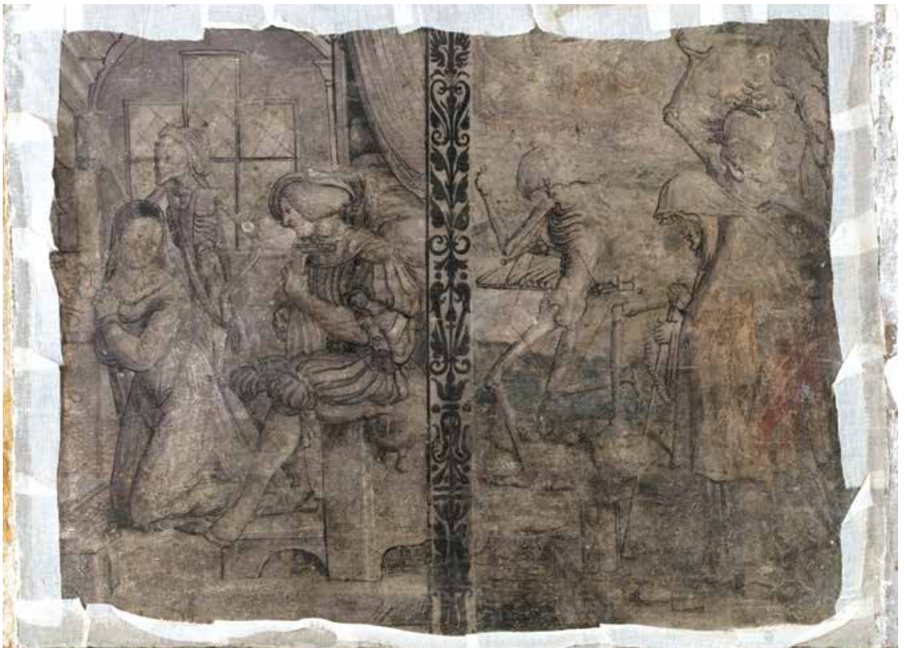
Todesbilder. Szenen Nr. 23 und 24, Jungfrau und Alte Frau.