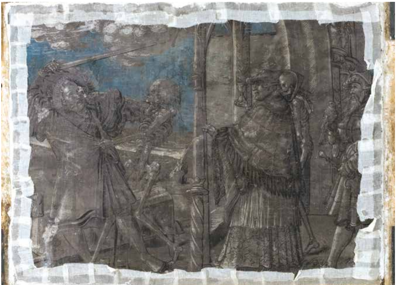
Todesbilder. Szenen Nr. 15 und 16, Graf und Domherr.