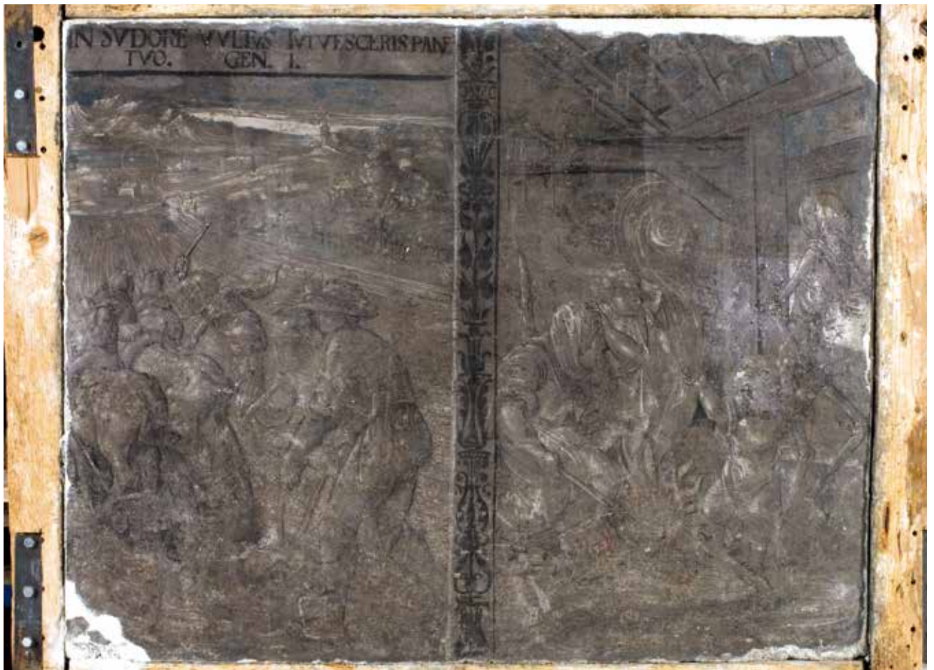
Todesbilder. Szenen Nr. 35 und 36, Bauer und Kind.