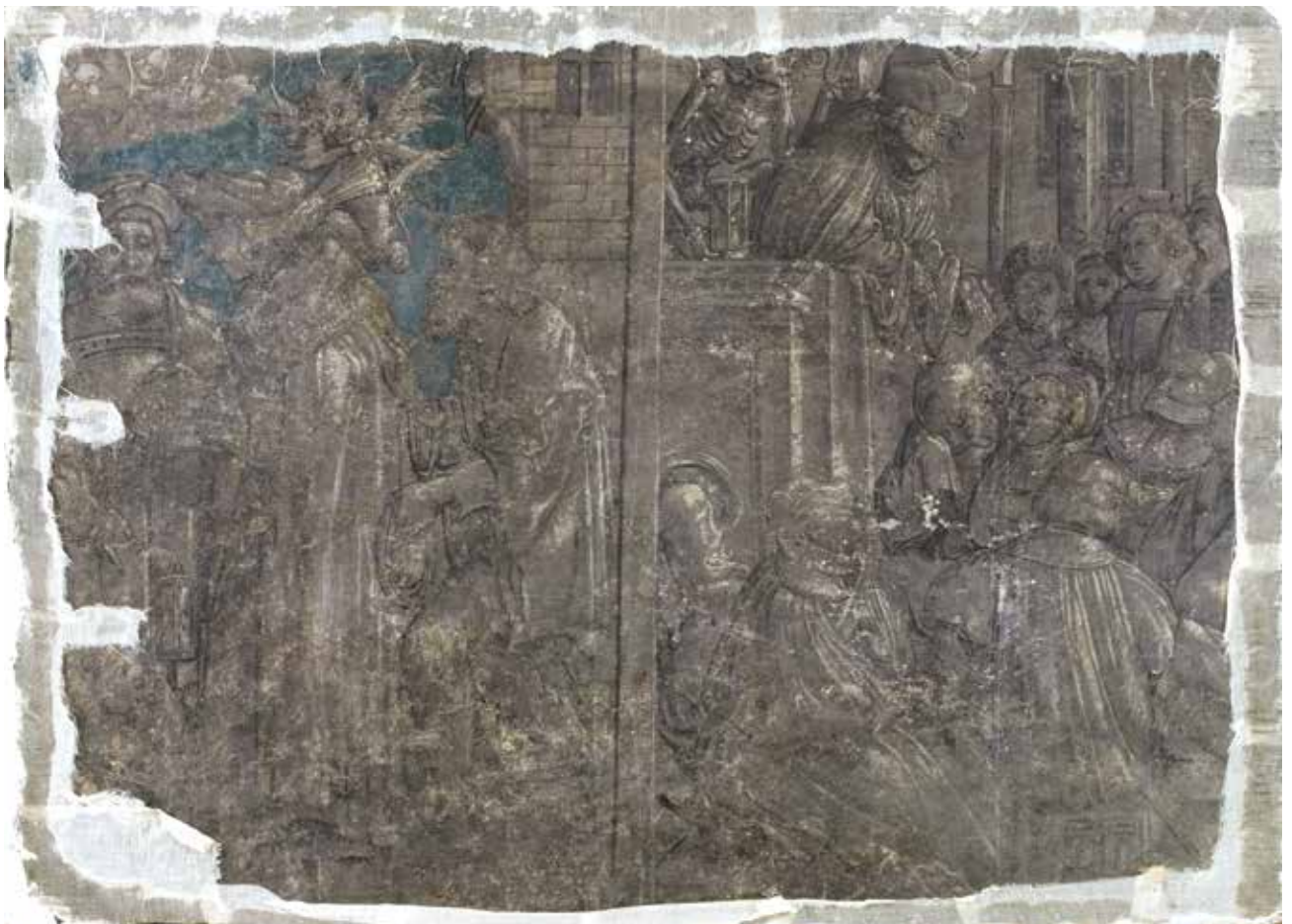
Todesbilder. Szenen Nr. 19 und 20, Jurist und Prediger.