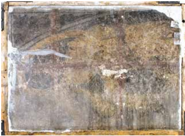
Todesbilder. Sockelfeld 5.