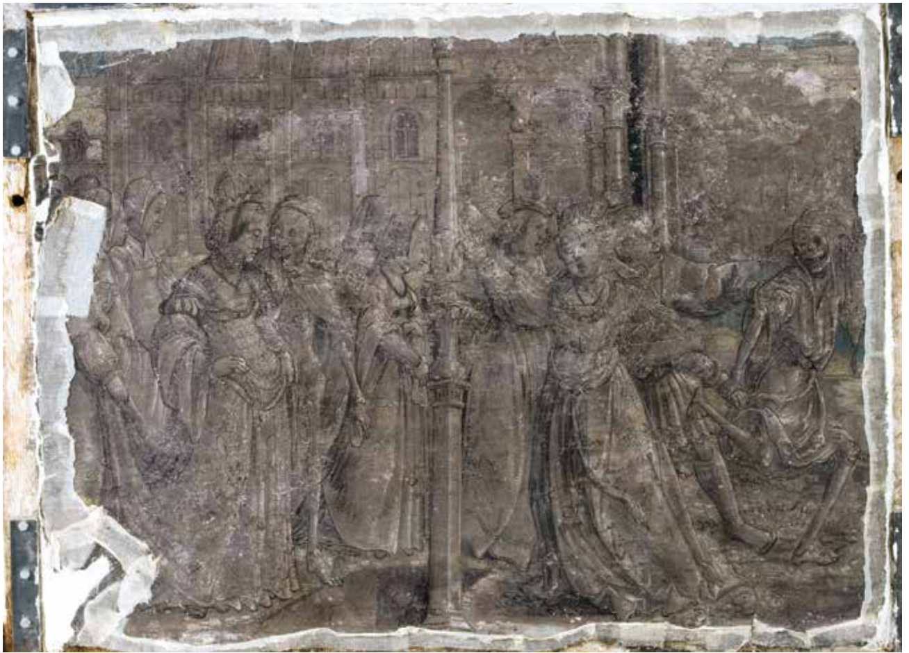
Todesbilder. Szenen Nr. 9 und 10, Kaiserin und Königin.