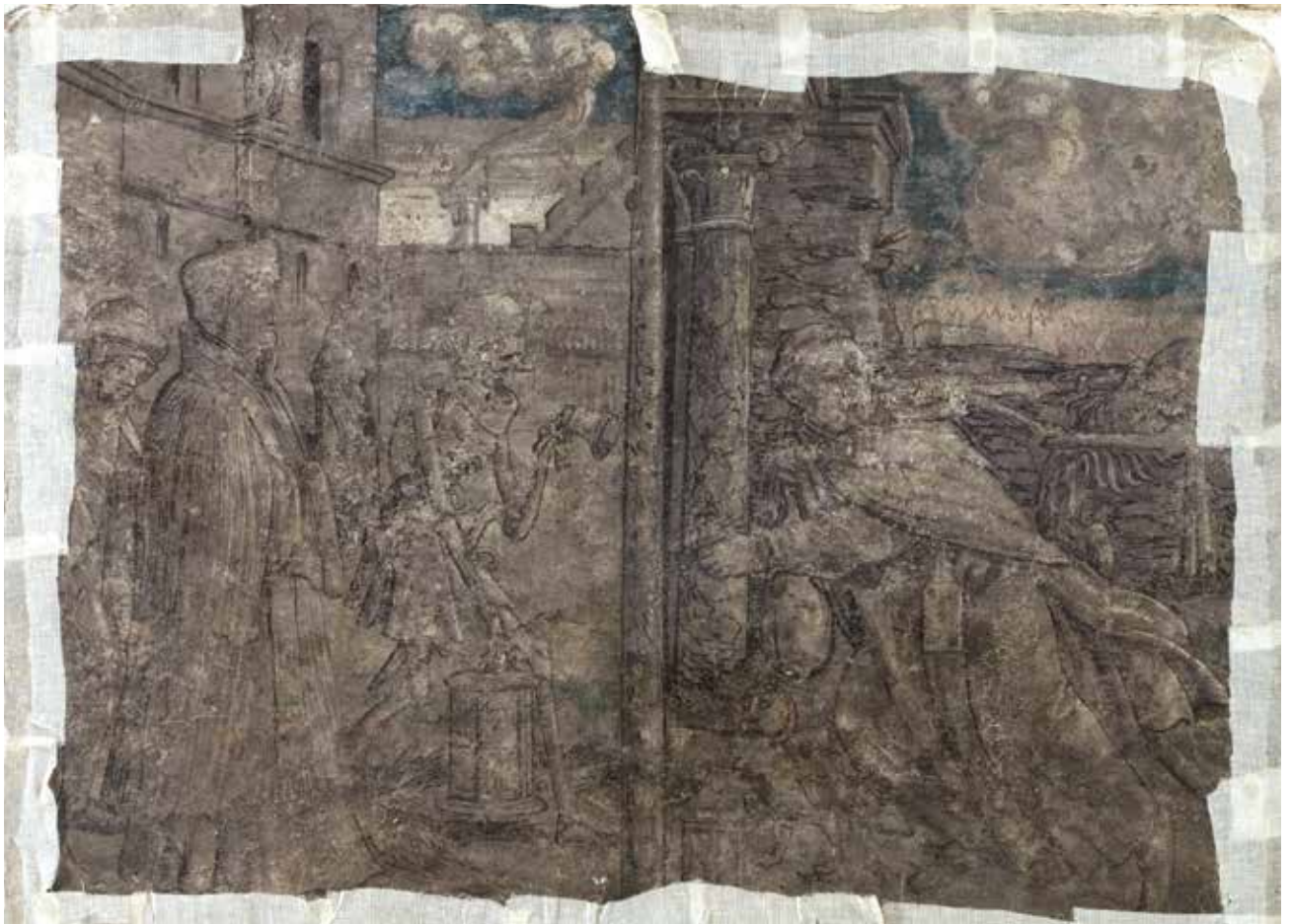
Todesbilder. Szenen Nr. 21 und 22, Pfarrer und Bettelmönch.