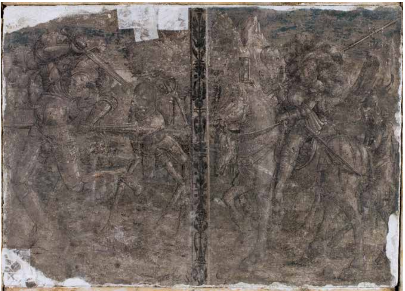
Todesbilder. Szenen Nr. 28 und 29, Ritter und Ritter, Tod und Teufel.