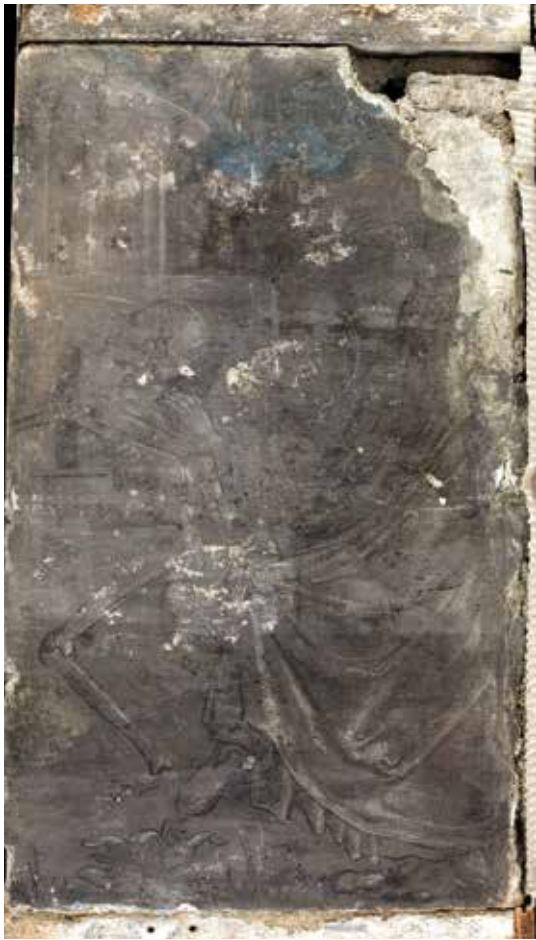
Todesbilder. Szene Nr. 13, Abt.