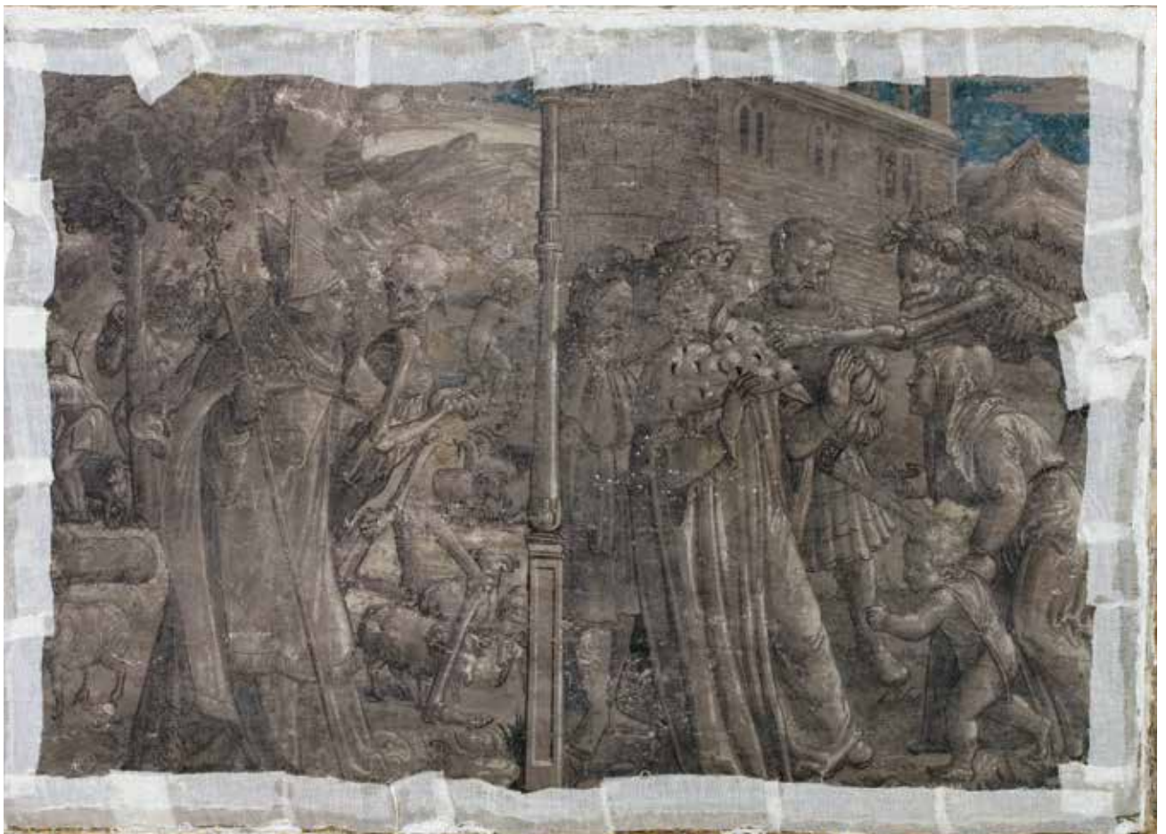
Todesbilder. Szenen Nr. 11 und 12, Bischof und Churfürst.