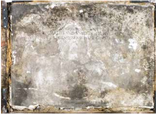
Todesbilder. Sockelfeld 1.