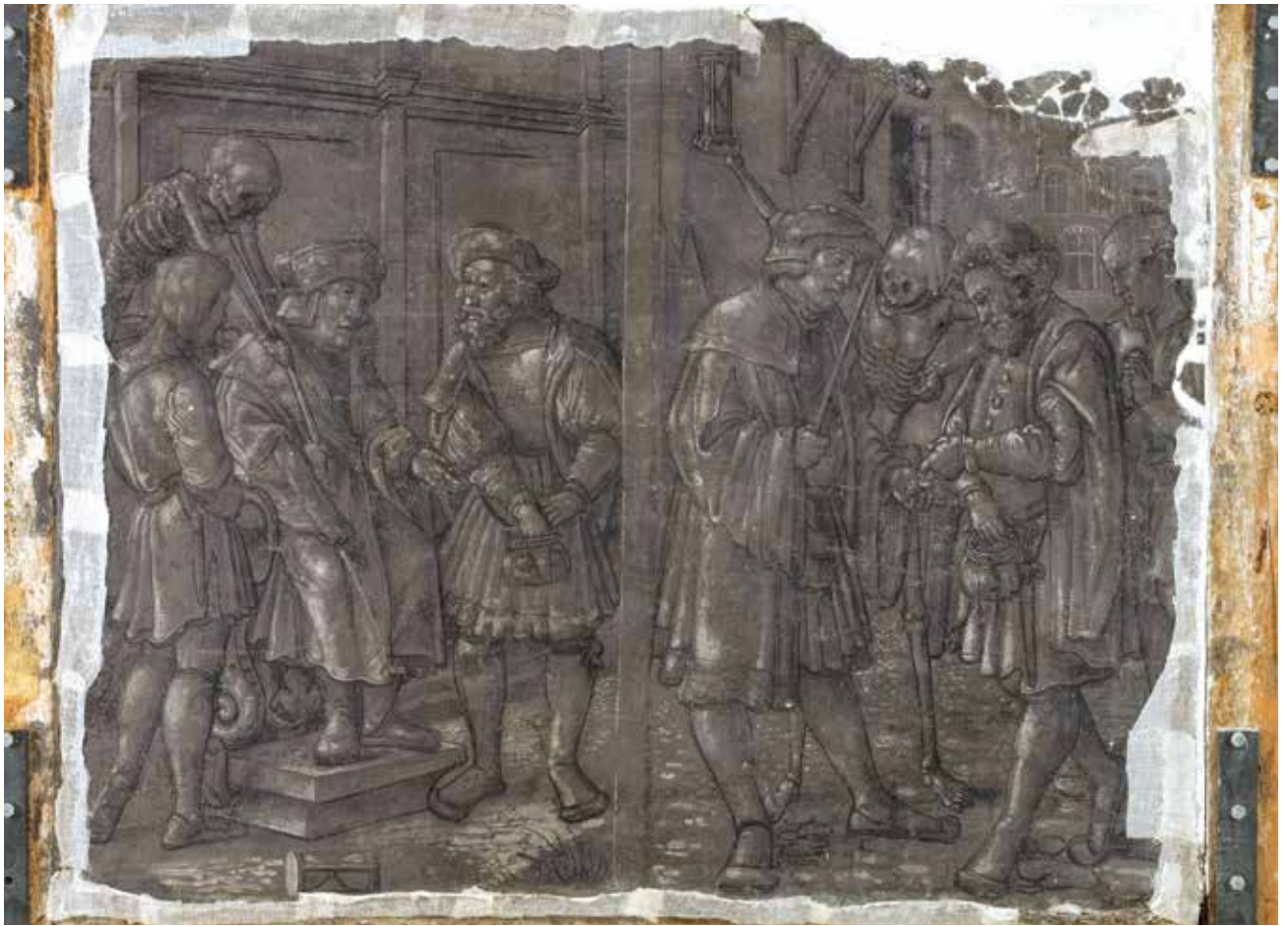
Todesbilder. Szenen Nr. 17 und 18, Richter und Fürsprecher.