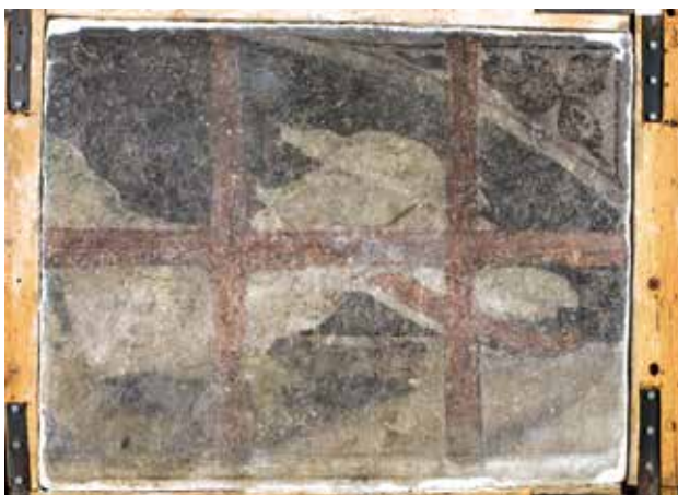
Todesbilder. Sockelfeld 8.