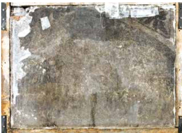
Todesbilder. Sockelfeld 4.