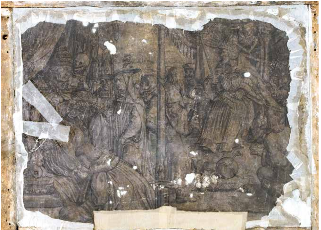
Todesbilder. Szenen Nr. 6 und 7, Papst und Kaiser.