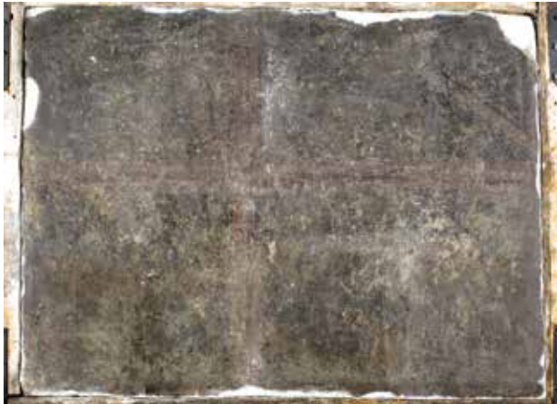
Todesbilder. Sockelfeld 2.