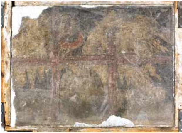
Todesbilder. Sockelfeld 6.