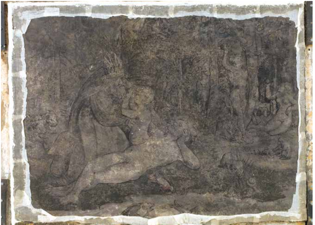
Todesbilder. Szenen Nr. 1 und 2, Schöpfung und Sündenfall.