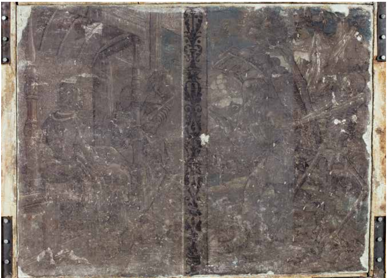
Todesbilder. Szenen Nr. 33 und 34, Herzogin und Krämer.