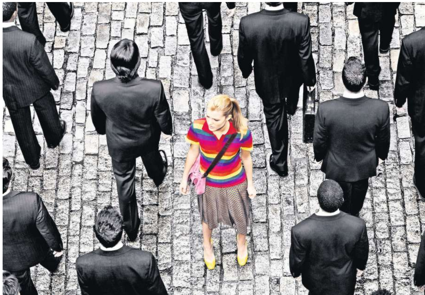
Wer sich nicht anpasst, fällt auf.