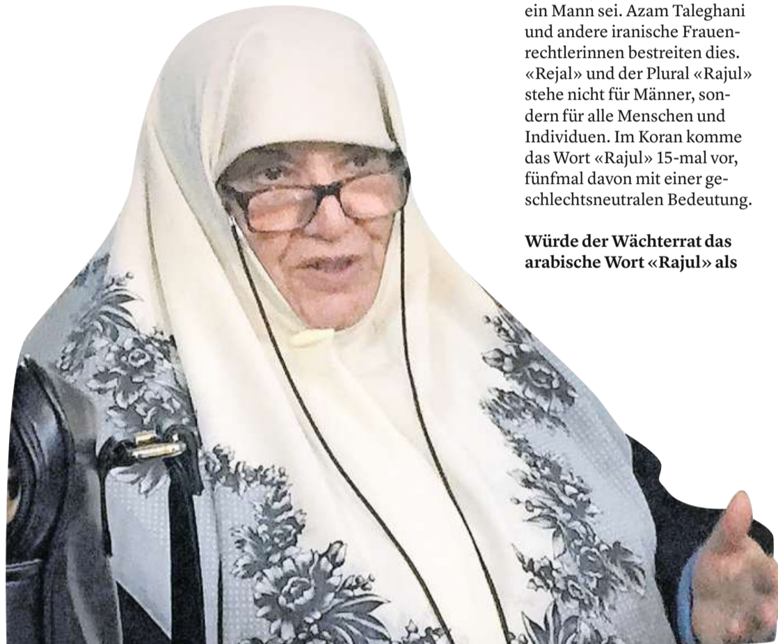
Azam Taleghani