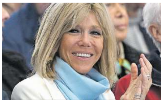
Brigitte Macron (64) , Ehefrau des französischen Präsidentschaftskandidaten Emmanuel Macron (39), nimmt den Altersunterschied zu ihrem Gatten mit Humor. 7

«Wer weiss, welches Gesicht ich bei der Kampagne 2022 haben werde.»